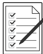
参加票記入・提出